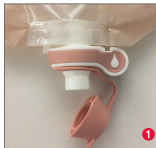
Poche ouverte : - Goutte blanche visible - Asymétrie du robinet