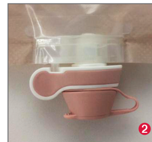
Poche fermée : - Goutte blanche non visible - Symétrie du robinet